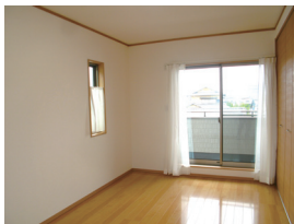
高い建物がなく陽当たり良好!