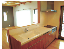
食洗機付きのシステムキッチン