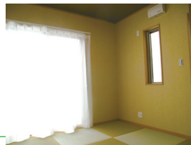
来客用にも使える、琉球畳が美しい和室