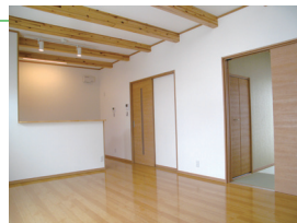
16帖のゆったりリビング!