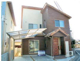
シンプルモダンで飽きのこない外觀