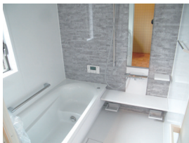
シンプルで使いやすい浴室